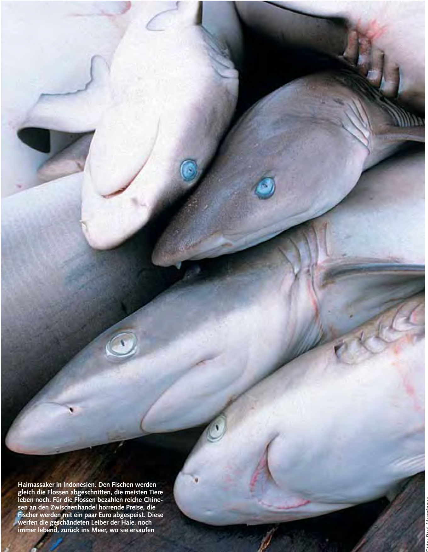
Haimassaker in Indonesien. Den Fischen werden gleich die Flossen abgeschnitten, die meisten Tiere leben noch. Für die Flossen bezahlen reiche Chinesen an den Zwischenhandel horrende Preise, die Fischer werden mit ein paar Euro abgespeist. Diese werfen die geschändeten Leiber der Haie, noch immer lebend, zurück ins Meer, wo sie ersaufen