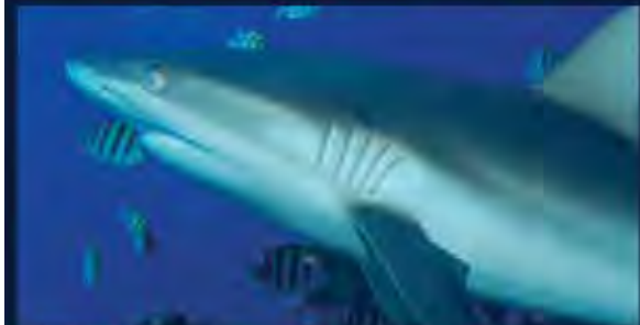
Weißer Spitze, Schwarze Spitze, Silberne Spitze oder einfach Grau - ganz ohne Spitze, Schatzi?