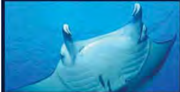
Wir kennen knapp 100 Mantas beim Namen - finde einen neuen und werde Taufpatel!