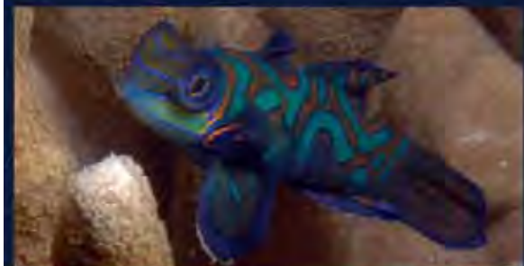
Joy of Sex? Unsere Mandarinfische genießen es täglich - fünf Minuten entfernt vom Resort