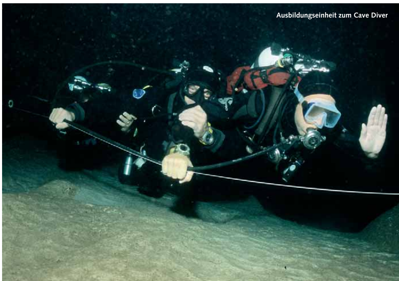
Ausbildungseinheit zum Cave Diver